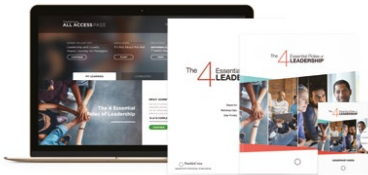
A tananyagok lokalizálás alatt állnak. Jelenleg csak angol nyelven érhetőek el.